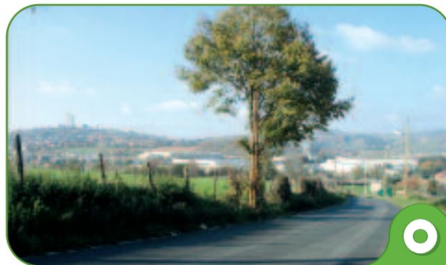
De la campagne à la ville via la zone industrielle