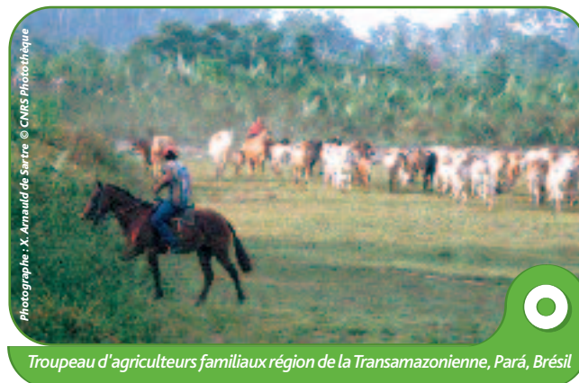
Troupeau d'agriculteurs familiaux région de la Transamazonienne, Pará, Brésil

notion de milieu, elle est potentiellement essentielle pour le développement durable.