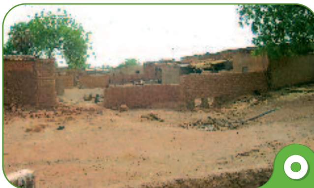
Kaya - assainissement

militantisme associatif et aux dynamiques de groupements sociaux spécifiques aux pays choisis.