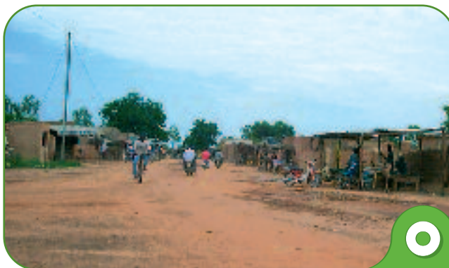
Ouagadougou - étalement urbain